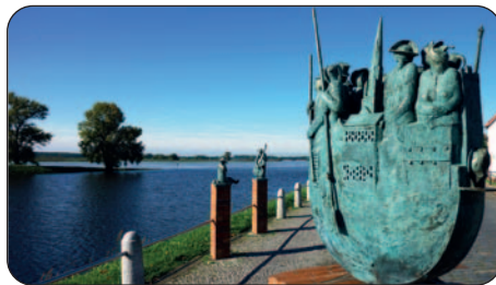
Wittenberge – Im Fluss der Zeit

Unsere erste Station ist die Stadt Wittenberge bei Elbe-Km 455, also schon nach etwa drei Stunden Fahrt. Wittenberge liegt malerisch in den Elbauen, unmittelbar an einer großen Eisenbahnbrücke. Die Stadt, Eisenbahnknotenpunkt zwischen Hamburg und Berlin, hat einen netten Sportboothafen. Früher war es ein bedeutender Industriestandort, bekannt vor allem durch die riesigen Singerfabriken, die Nähmaschinen in alle Welt lieferten. Vor dem Zweiten Weltkrieg arbeiteten hier über 3000 Menschen. Übertagt wird das Fabrikgelände von dem riesigen Uhrenturm, in dem sich ein kleines Singer-Museum befindet. Die Uhr selbst ist die größte auf dem europäischen Festland, fast so groß wie Big Ben in London. Zu DDR-Zeiten produzierte hier die größte Nähmaschinenfabrik des sozialistischen Wirtschaftsraums unter dem Namen Veritas. Heute heißt das frühere Fabrikgelände Veritas-Park; zahlreiche kleine Unternehmen haben sich hier niedergelassen. Die teils verfallenen Gebäude von früher wurden in den letzten Jahren oft als Locations für Filmproduktionen genutzt – für Filme, die im Krieg oder der unmittelbaren Nachkriegszeit spielten. So für Filme über Axel Springer und Beate Uhse. Die frühere Ölmühle dient jeden Sommer als Kulisse für die überregional bekannten Elblandfestspiele. Im