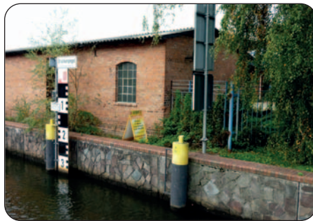
Ob wir durchpassen...

Die Schleuse Dömitz (Hub 1,5 m, Tel. 038758-22725) erwartet uns hinter einer Klappbrücke mit 4,8 m lichter Höhe. Die Kammer ist geöffnet. Aber die Drehbrücke zeigt Doppelrot nebeneinander mit einem weißen Licht darüber. Aufstoppen und warten? Wer es nicht mehr weiß: Gemäß § 6.26 Binnenschiffahrtsstraßenordnung dürfen Fahrzeuge bei diesen Lichtern