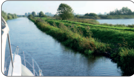
Zwischen den Teichen

Neuhöfer und Friedensmoorer Karpfenteiche, wo Tausende von Wasservögeln rasten, futtern, schnattern