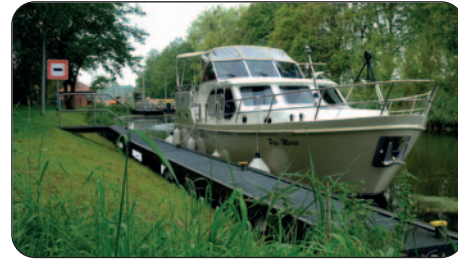
An der Hechtsforthschleuse

uns: „Die Wasserschutzpolizei lasert, also fährt vorsichtig.“ Wir verpassen unserem Hand-GPS neue Batterien und schalten den Modus „Geschwindigkeit in km/h“ ein. Da bis Schwerin ein Dutzend Schleusen vor uns liegen, haben wir keine Zeit zu verlieren. Die erste in Neu Kaliss (Hub 2,1 m, SB) kommt bei MEW-Km 5. Bei der kombinierten Klappbrücke und Schleuse (Hub 2,1 m, Tel. 038758-24112) einen Kilometer weiter klemmt die Technik. Wir müssen eine Stunde warten. Bei MEW-