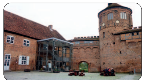
Burg in Neustadt-Glewe

Nach einem deftigen Frühstück mit Rühr-ei, Speck und Krabben legen wir am nächsten Morgen ab, um gleich in die SB-Schleuse Neustadt-Glewe (Hub 2,2 m) einzufahren. Dann folgen die Naturreservate