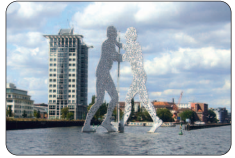
Molecule Man in Treptow

Hier ist es an der Spree recht ländlich und idyllisch, nur gelegentlich erinnern verlassene Fabrikgebäude an den früheren so wichtigen Industriestandort mit der AEG und einem Automobilwerk.